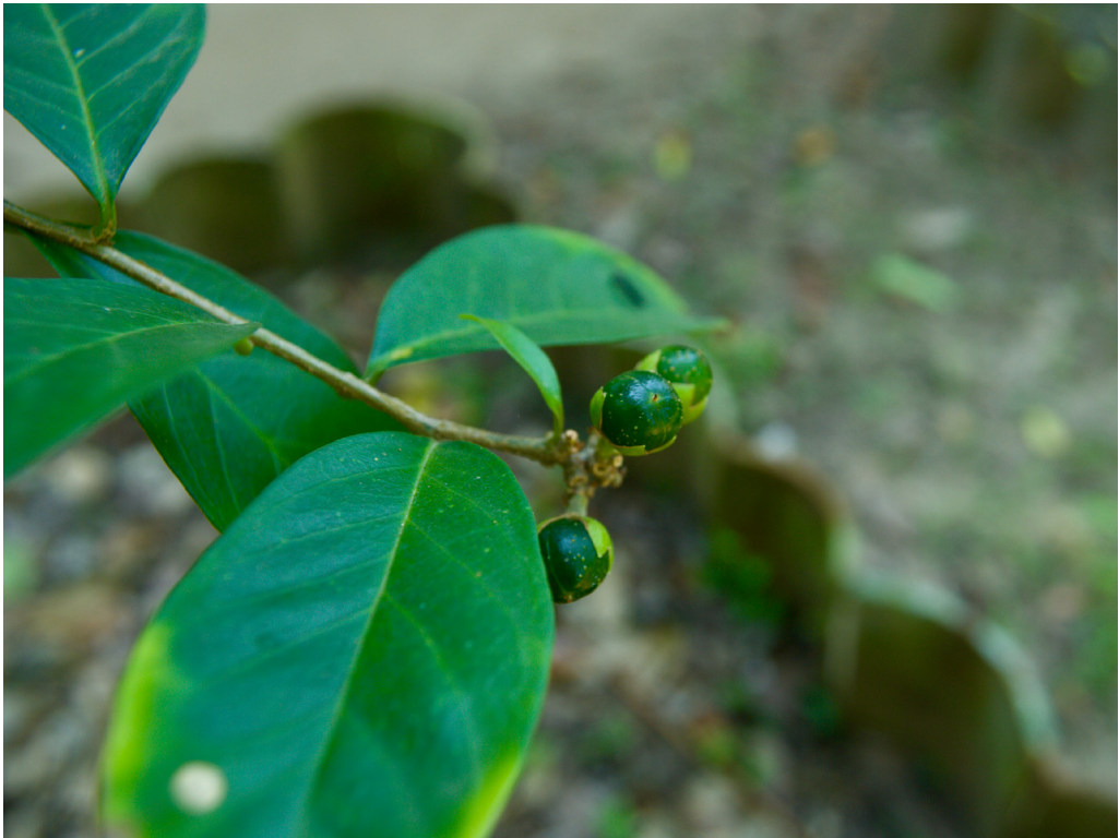
Fig. 14 Chiric sanango.