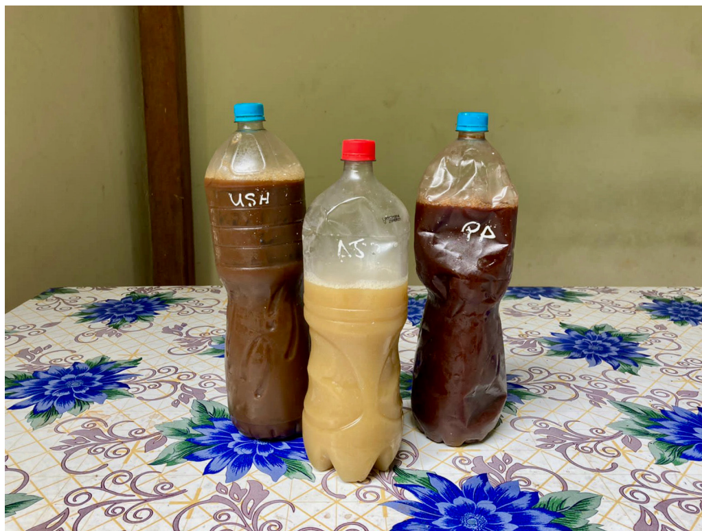
Fig. 17 Preparaciones de las plantas de contención.

Generalmente se toma una dosis de la planta de contención por las noches para aprovechar la influencia que tiene sobre la actividad onírica. Sin embargo, hay plantas (como la coca y el ajo sacha) que, por sus efectos, es mejor tomarlas por las mañanas, para no perturbar el sueño y, por ende, el ritmo de vida normal del usuario. Las preparaciones están señaladas en la figura 17.