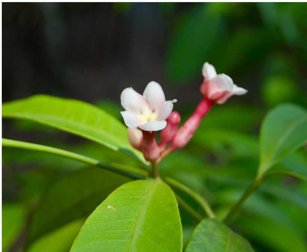
Fig. 15 Ushpawasha sanango.