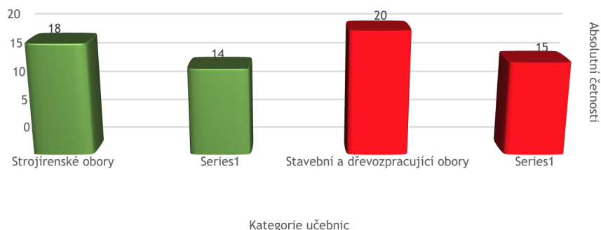
Graf 2: Učebnice využívané v technických oborech (strojírenské, stavební a dřevozpracující obory) Zdroj: vlastní